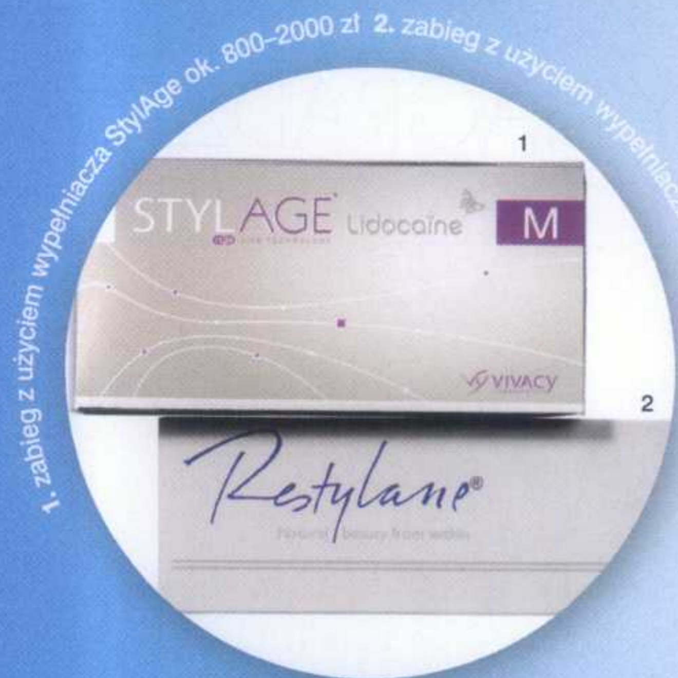
1. zabieg z użyciem wypełniacza StylAge ok. 800-2000 zł 2. zabieg z użyciem wypełniacza Restylane ok. 500-2500 zł