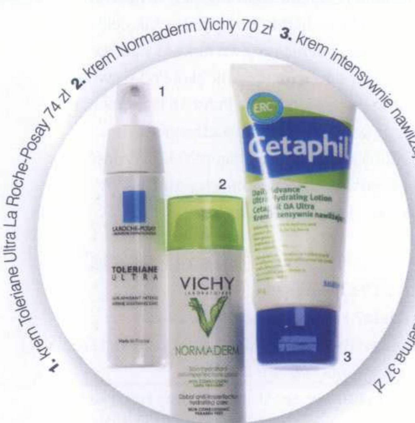
1. krem Toleriane Ultra La Roche-Posay 74 zł 2. krem Normaderm Vichy 70 zł 3. krem intensywnie nawilżający Cetaphil Da Ultra Galderma 37 zł