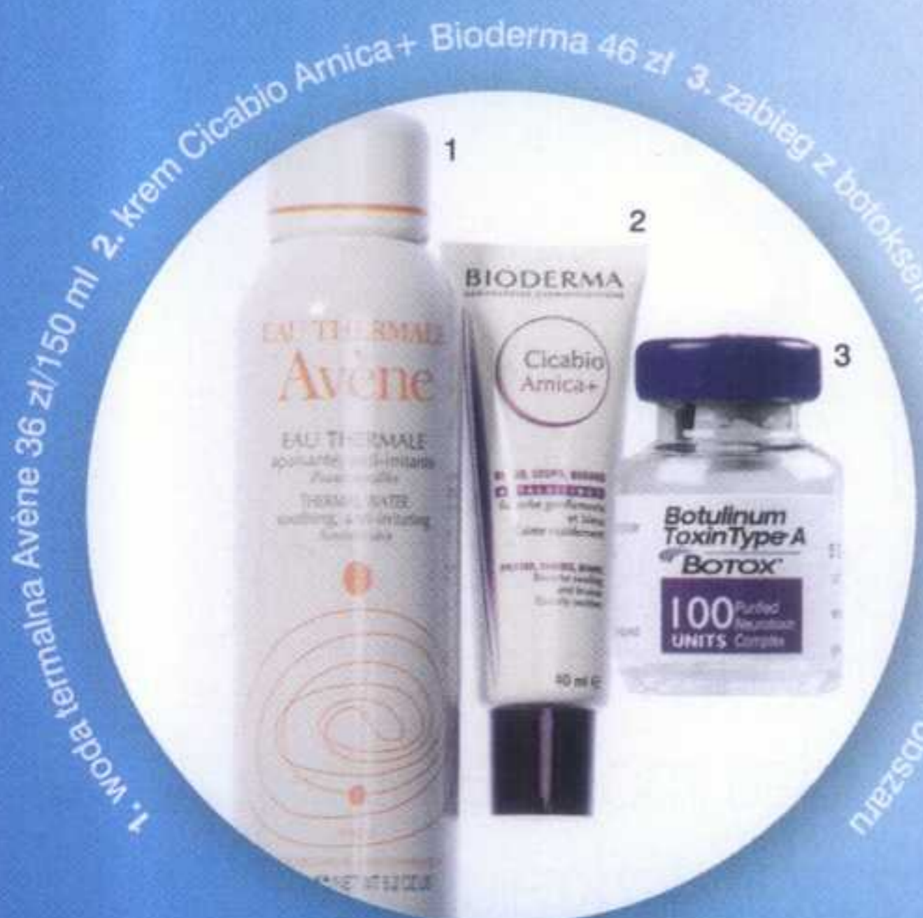
1. woda termalna Avène 36 zł/150 ml 2. krem Cicabio Arnica+ Bioderma 46 zł 3. zabieg z botoksem ok. 250-600 zł, zależy od obszaru