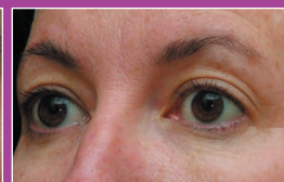
4 miesiące po zabiegu Thermage®